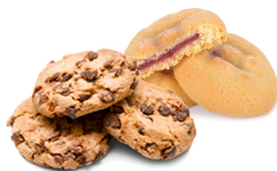
PRODOTTI DA FORNO