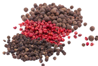
SPEZIE IN GRANI