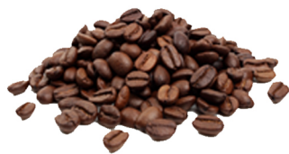
CAFFÈ IN GRANI